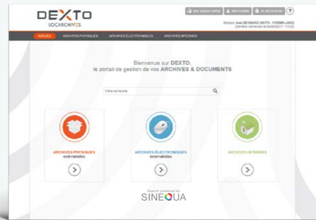
Retrouvez votre document en moins de 3 secondes