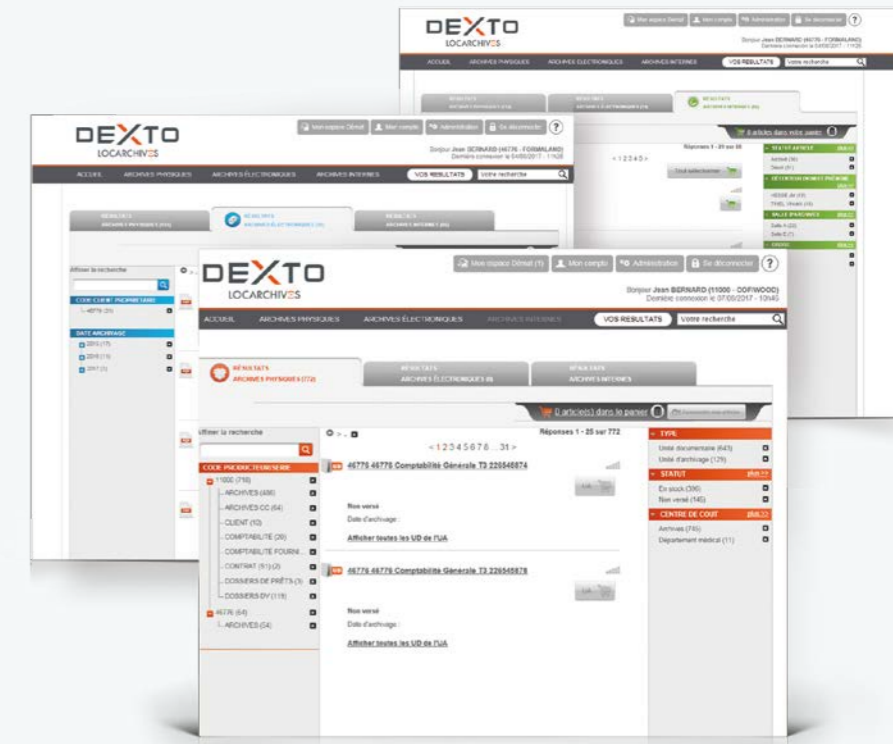
Un résultat de recherche clair et organisé selon votre plan de classement